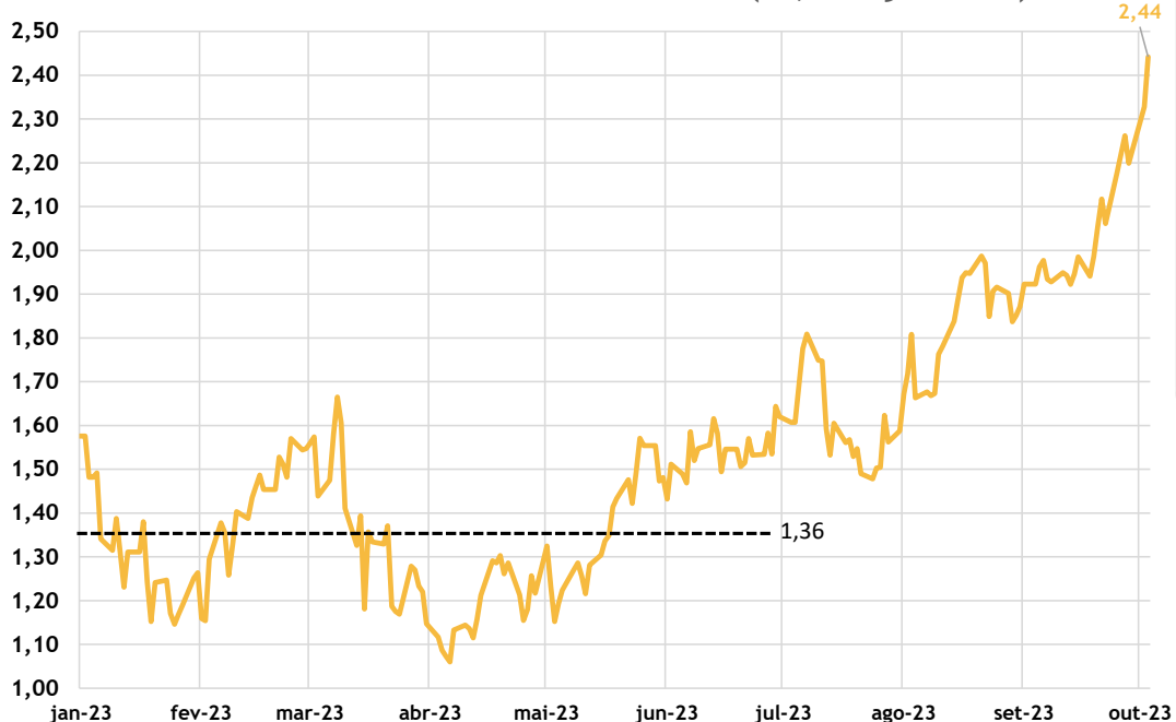
EUA: Juro Real de 10 Anos (% , 10y TIPS)

Esses temas, em maior ou menor grau, têm levado a uma importante reprecificação de toda a curva de juros nos EUA – e, conseqüentemente, no mundo –, com destaque para um grande movimento de abertura dos juros reais de 10 anos norte-americanos, que superou 2,4% a.a. nos últimos dias, contra uma taxa média de 1,35% observada ao longo do 1S23, ou seja, um movimento superior a 100 bps concentrado nos últimos 2 meses.