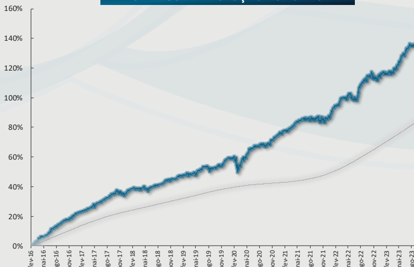
GRÁFICO DE EVOLUÇÃO DO FUNDO