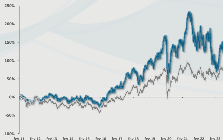
GRÁFICO DE EVOLUÇÃO DO FUNDO