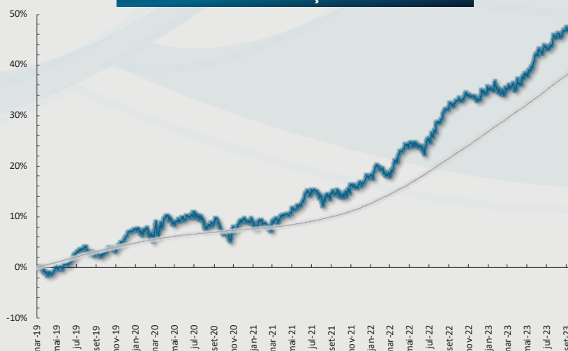
GRÁFICO DE EVOLUÇÃO DO FUNDO